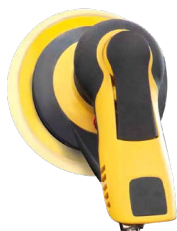
Lixadeira orbital pneumática com almofada Ø 150 mm MIRKA PRO S 650HP ref. 071346