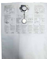
1 saco de pó (ref. 058880 - 5 sacos)