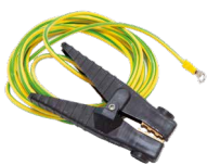
1 pinça de massa