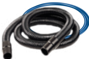
1 mangueira de 5 m | Ø 29 mm