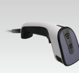
Leitor de código de barras 1D/2D 027718