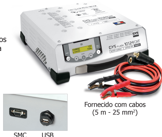
Fornecido com cabos (5 m - 25 mm 2 )