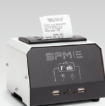
SPM : Smart Printer Module 026919