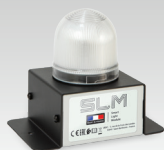
SLM : Smart Light Module 027978