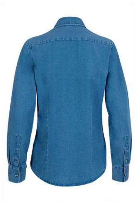
Vista parte traseira da peça (costas)