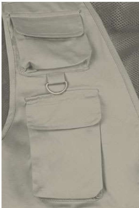
Detalhe bolso e anel no peito superior direito