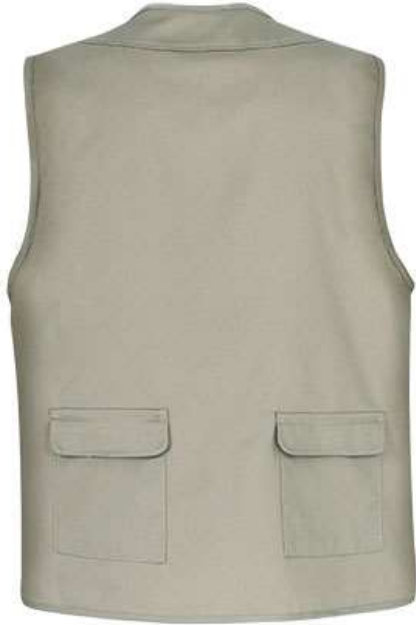
Vista parte traseira da peça (costas)