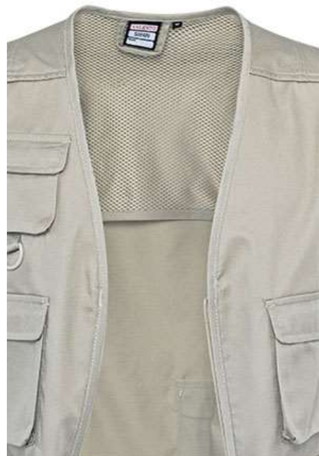
Detalhe rede interior nas costas, zona superior