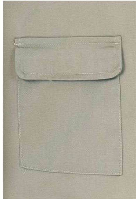
Detalhe bolso inferior traseiro com tapeta