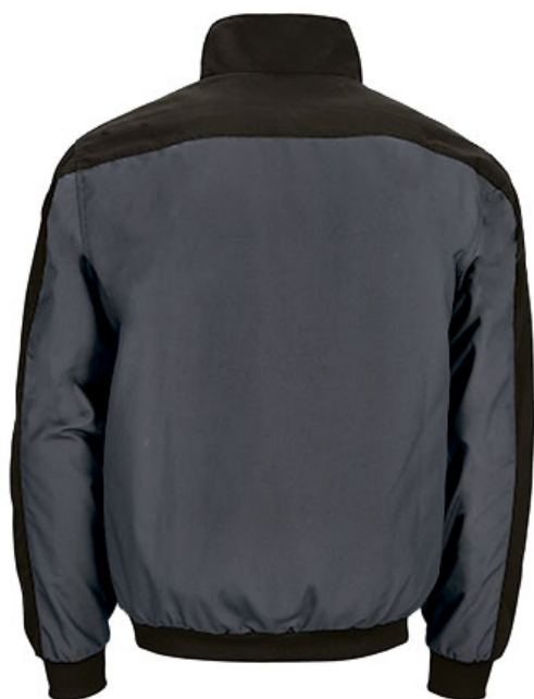
Vista parte traseira da peça