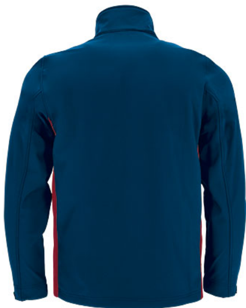
Vista parte traseira da peça