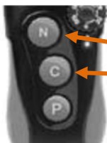
Bouton NICK et Bouton CONTINU de l'émetteur.