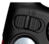
Sélecteur chien I / chien II