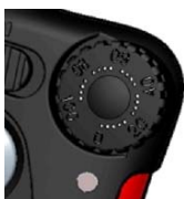
Bouton d'intensité sur l'émetteur