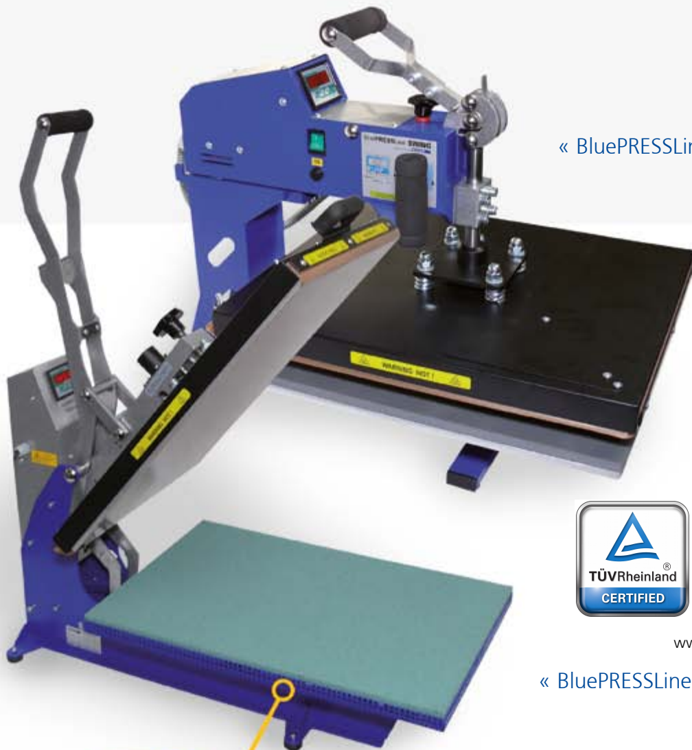
« BluePRESSLine Swing

after reaching the transfer application time. The BluePRESSLine „S“ series does the job for you and opens the press automatically. The BluePRESSLine „S“ models are available with three different sized base platen.