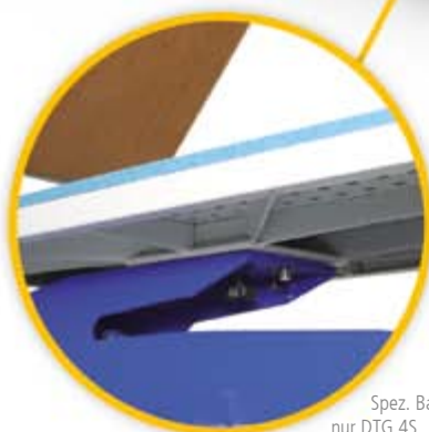
« BluePRESSLine DTG 4-S